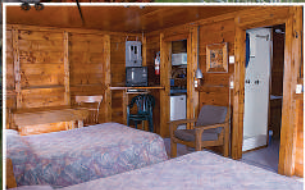
BED-SITTING CHALET • CHALET À AIRE OUVERTE