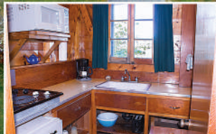
BED-SITTING CHALET • CHALET À AIRE OUVERTE