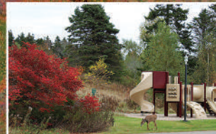
PLAYGROUND • AIRE DE JEU