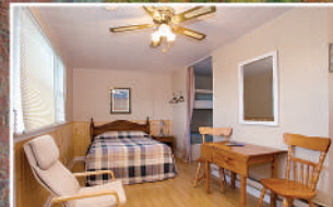
MOTEL STUDIO • CHAMBRE STUDIO