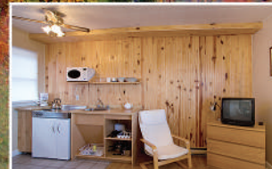
MOTEL STUDIO • CHAMBRE STUDIO