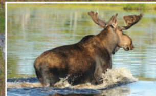
BENNETT LAKE • LE LAC BENNETT