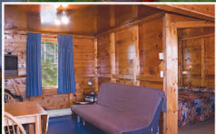
ONE-BEDROOM CHALET • CHALET CHAMBRE FERMÉE