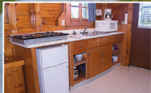
ONE-BEDROOM CHALET • CHALET CHAMBRE FERMÉE